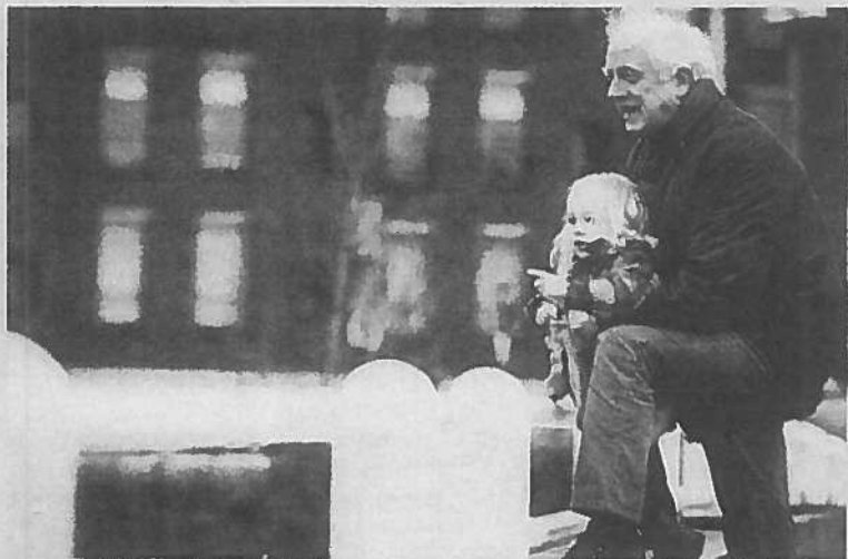
Wie bepaalt of een kind 'u' of 'jij' zegt tegen een oudere?

Reageren? Zelf een vraag insturen? Mail naar opvoedvraag@trouw.nl